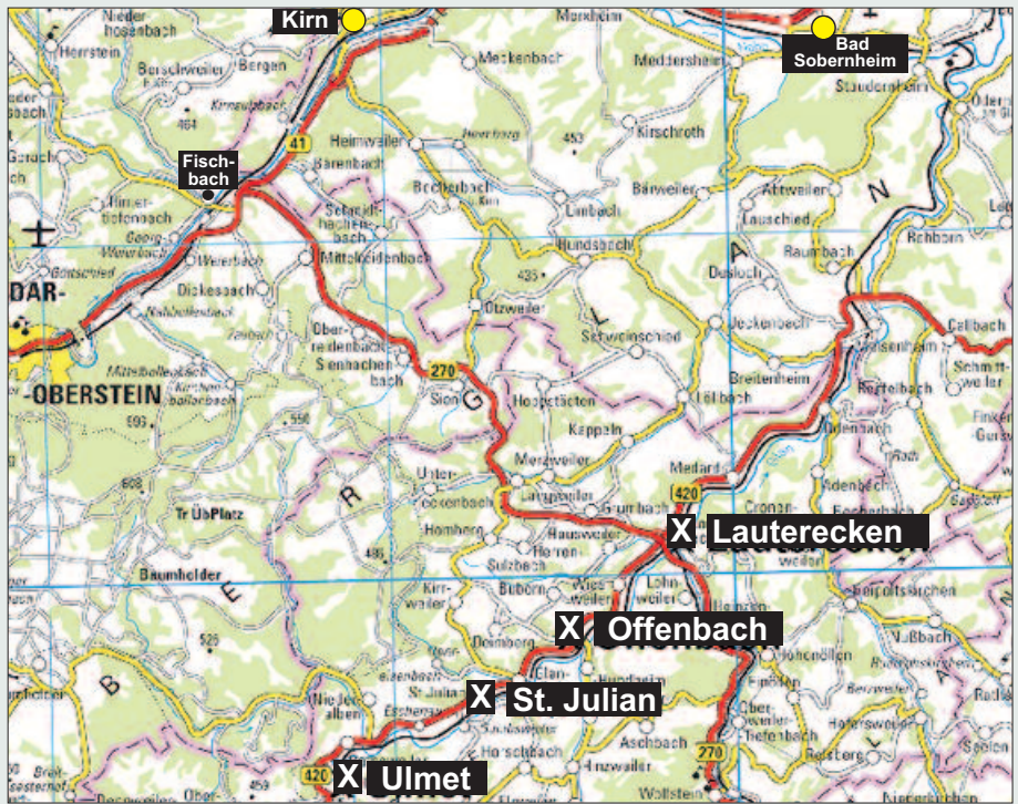
Anfahrt und Wanderstrecke 2020